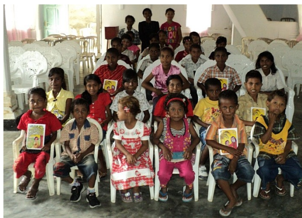
Školní děti s přeloženými biblickými příběhy

Náš poslední den byl pro mě v tomto smyslu doslova odměnou od Nejvyššího. Navečer za mnou přišli církevní vedoucí s tím, zda bychom i přes nepřítomnost některých lidí mohli mít původně plánovaný „mini-seminář“ o tom, jak si připravit nejrůznější ztišení, zamyšlení či různou